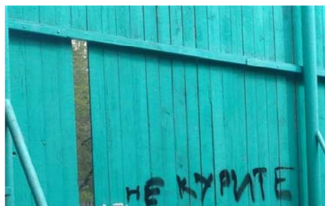
Рис. 6 Fig. 6

Примеры визуальной репрезентации конструирующей функции вандализма