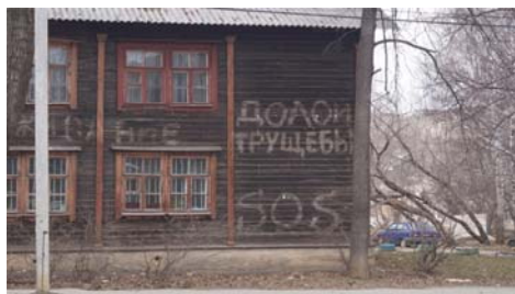
Рис. 13 Fig. 13

Рис. 13 и 14 демонстрируют реализацию функции возмещения: на одном заснято здание барачного типа с лозунгом, сигнализирующим о социальной несправедливости; на другом критике подвергается конкретное профессиональное сообщество.