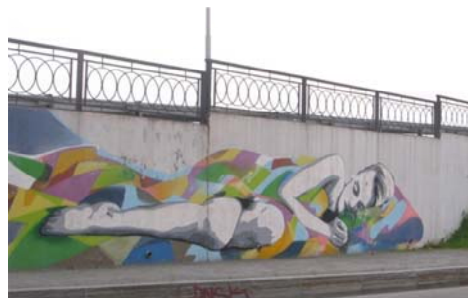
Рис. 8 Fig. 8

Примеры визуальной репрезентации функции управления общественными настроениями