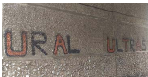
Рис. 3 Fig. 3

Таким образом, посредством вандализма становится возможным разрушение старых и продвижение новых форм работы с прошлым, традиционным и привычным, изменение исторической памяти, формирование новых социальных установок вопреки сложившимся общественным отношениям. Вандализм (особенно направленный против идеологических символов прошлого, ценностно значимых объектов старших поколений или неких аутгрупп) выступает в этом случае антикоммеморационным инструментом, модифицирующим объект в общественном пространстве и приписывающим ему новые значения для последующей его замены новым символом [21].