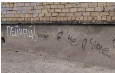
Рис. 5 Fig. 5

Фотографии на рис. 5 и 6 экспонируют варианты сопротивления стереотипному девиантному поведению (алкоголизму) и стремлению пропагандировать с помощью вандальных актов здоровый образ жизни современного горожанина.