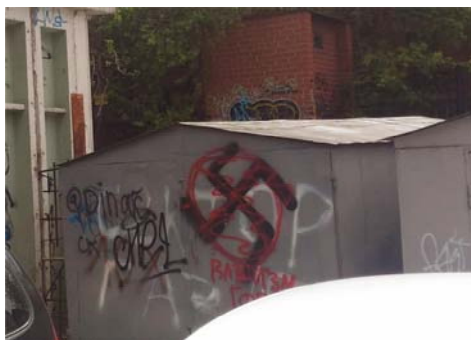
Рис. 1 Fig. 1

Например, на рис. 1 и 2 представлено «заочное» сражение двух политических идеологий. Данная репрезентация «сигнализирует», во-первых, о том, что две противоборствующие силы вступают в схватку и готовы об этом публично заявлять. Во-вторых, они внимательно наблюдают за действиями своих оппонентов и опровергают их, а вандальные репрезентации других форм городской культуры их просто не интересуют.