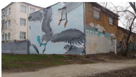
Рис. 15 Fig. 15

Однако не только райтеры используют вандализм в качестве инструмента самовыражения и раскрытия креативного личностного потенциала. К этой модели самореализации могут прибегать другие, обычные горожане. На рис. 15 и 16 приводятся примеры такого материального воплощения творческих способностей: на одной фотографии на торце постройки изображен полет стаи птиц, на другой – дерево как символ жизни.