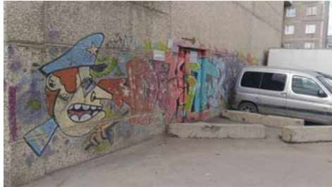
Рис. 9 Fig. 9

вом персонаж-полицейский изображен в сочетании с запретительной табличкой о стоянке машин; второй является стихийной агитацией за политического лидера.