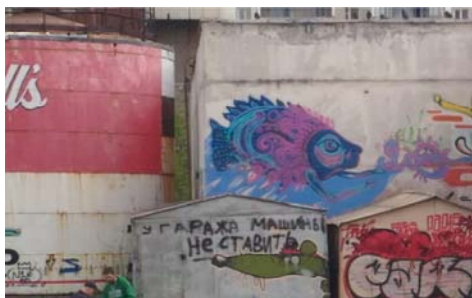
Рис. 7 Fig. 7