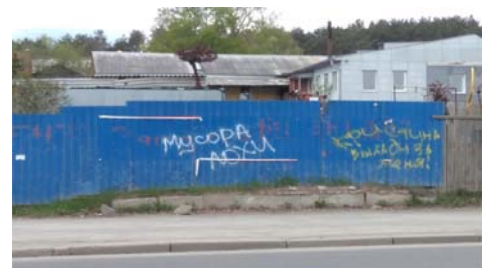
Рис. 14 Fig. 14

Примеры визуальной репрезентации функции возмещения Examples of visual representation of compensative function