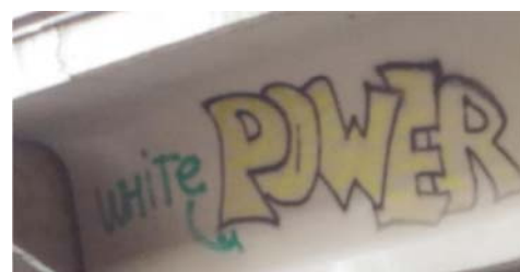
Рис. 4 Fig. 4

Примеры визуальной репрезентации функции подготовки к социальным изменениям Examples of visual representation of functional preparation for social changes