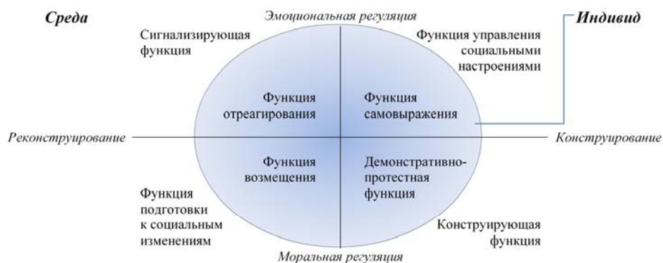
Рис. 17. Модель функций вандализма в пространстве взаимодействия личности и среды

Обобщая все вышеперечисленные функции вандализма, мы построили схему, иллюстрирующую их соотношение по нескольким основаниям (рис. 17).