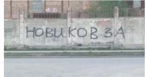
Рис. 10 Fig. 10

Примеры визуальной репрезентации демонстрационно-протестной функции