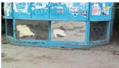
Рис. 11 Fig. 11

Предметы и конструкты, подвергающиеся вандализму, могут быть связаны с источником негативных эмоций (человеком, ситуацией и пр.), а могут вообще не иметь к нему никакого отношения. В последнем случае разрушению либо преобразованию подвергается наиболее доступное пространство. Это могут быть культовые для конкретной субкультуры территории и объекты, места с низкой степенью социального контроля: пустыри, гаражные комплексы, промзоны и т. п. Например, объекты, зафиксированные на рис. 11 и 12, частично разрушены в зонах, доступных для вандала: у одного (торгового павильона) на нижнем уровне разбиты зеркальные поверхности, у второго (рекламы магазина) разорвана поверхность полотна.