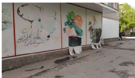
Рис. 12 Fig. 12