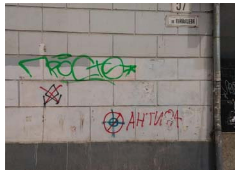
Рис. 2 Fig. 2

Примеры визуальной репрезентации сигнализирующей функции вандализма Examples of visual representation signalling functions of vandalism